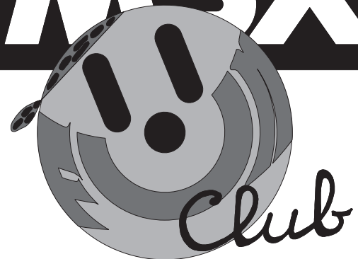
Foto Schau 1989 bis 2003